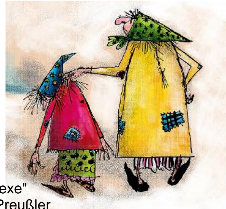
"Die kleine Hexe" von Otfried Preußler